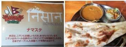
野菜カレーとナンのランチプレート