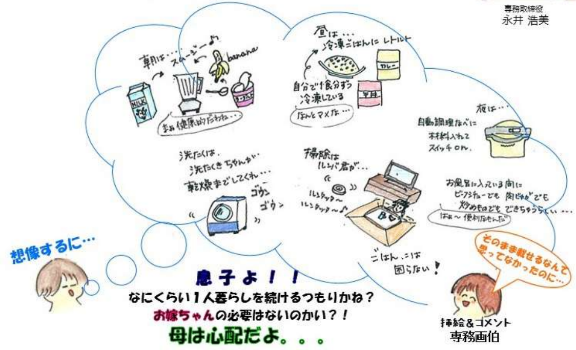
挿絵&コメント 専務画伯

さて、もうひとつ。お風呂上りに洗面所で倒れたというお話を聞きました。冬は、やはりコレが一番気を付けなければいけませんね。お風呂に入る時ではなく、暖かい浴室から寒い洗面所へ。この時に倒れる事故が、実は交通事故よりも多いとか。最近の研究では、室温が1℃低い所に住むと2歳老化が早まるらしいですよ。