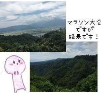
マラソン大会 ですが 絶景です!