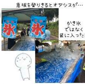
急坂を登りきるとオアツスが… かき氷 ではなく 袋に入った氷