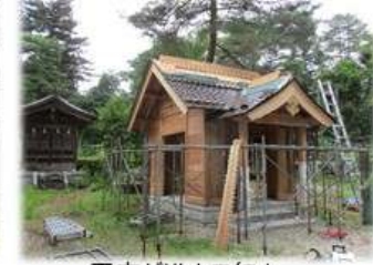
工事が進んで行き