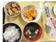
痛み止を一切使わず 腹を暖か～とばかに 朝食をペロリ!