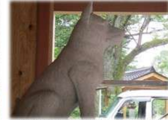
ボクの居場所を作ってくれたワン

《しろ》は江戸から約70里(三百キロ)、長岡の旧飼主の家に戻って来たが「殿様に差し上げたのだから」と家には入れては貰えず城に戻るように諭された。しかし《しろ》は城には戻らず少し離れた小高い丘の上で数日間悲しく鳴き続けながら息絶えた。