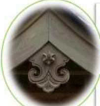
全て手彫り宮大工のお仕事です

神社のお守をよく見かけますが、何ていうかご存知ですか? 豆知識 懸魚(ゲギョ)と云います