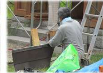
匠の技を発揮して