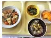
ここまでまだ5層会館で食っちゃっ と美味しくいただきました ごちそうさま!!