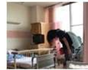
退院の日 長岡祭りの中 松葉杖をつながら バスに乗ってかえりおした とす