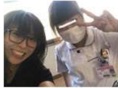
まずは担当ナースちゃんとパチリ お母さんと同じ年です～と言 マジか…