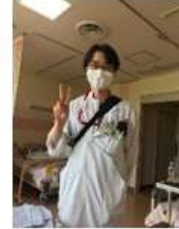
主治医登場 整形外科医 手の外科先生 穏やかで優しい先生です