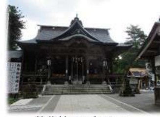
蒼紫神社の右手に...