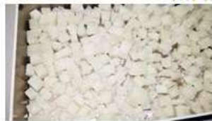
ここまで小さく切るのは結構大変 しかも猫くわえて逃走するし