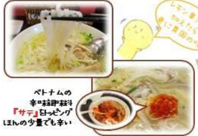
ベトナムの 辛味調味料 「サテ」はベトナム ほんの少量でも辛い