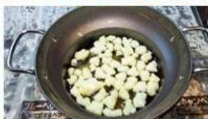
EHは周りに新聞紙敷く事ができ 後片付けの手間を省く

最初は大きく切り過ぎてしまい 鍋から溢れさせてしまったのですが 小さく切り直して カラッカラに乾燥させ 上手にできましたよ! 懐かしい味を楽しむ事ができました。