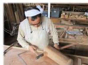
本体にピッタリ合うように作る技は さすがプロ!