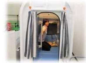
先陣切って、専務がお試し「これ以上キレイになったらどへしよ〜」