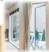
開き窓 気密性は◎使い勝手△