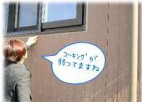
「コナン」が 呼んでまわね 家中の健康診断中 風・日辺りの良い面の 外壁は傷み易い