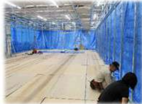
工場内にクリーンルーム設置 軽量間仕切り工事も請け負います