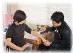
「腕が痛いよ〜」と超音波治療中凝った腕が軽くなり、痛みも消えたそう