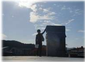
屋上へ上がって確認中 って...ポーズ決めすぎでしょ