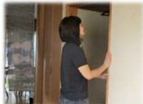
戸の開け閉め すべり確認 確かに滑りが悪い