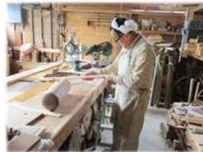
柄を桜の堅木で制作