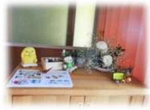
玄関に9月号かわらばん「DIY特等」今日号も置いてもらいましょ♪