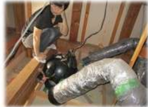
屋根裏に潜入 旧型換気システムの前で思案中?

勤務時間の殆どを専務と共に行動していると思う事。『男前』脚立にヒョイヒョイと登り屋根裏へ行ったり、汚れなど気にせず床下へ潜ってみたり... 身が軽く小柄のせいもあるのでしょうか、お客様のお困り事を自分の目で確かめています。今回は、そんな専務の日常をド～んとご紹介します。