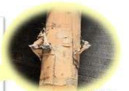
この箇所が 1番負荷がツツる