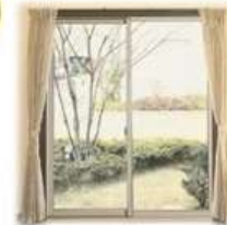
引違い窓 気密性は△使い勝手◎

家が暖かければ暖かい程、この隙間風が気になるもの。 また、ソファーなどに腰掛ける生活より 床に座る生活の方が、より隙間からの冷気を感じます。