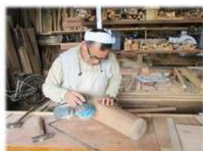
面取りを行い完成

～専務の独り言～ こうやって毎号毎号 私の面白画像を載せてありますが 全部、添いのヤラセですから 私はただ、毎日「真剣」に 仕事しているだけです