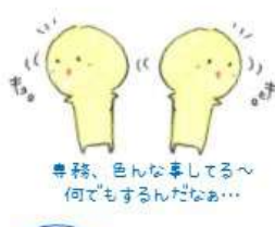
専務、色んな事してるへ 何でもするんだなあ...