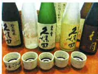
まずは併設されている 試飲コーナーで