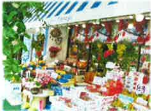
外観はまるでお花屋さん