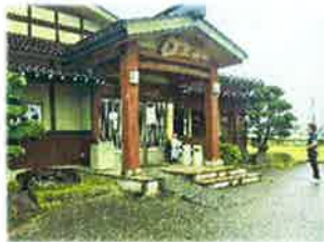
蕎麦屋の前で佇む専務