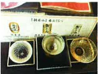
飲み比べセットでご満悦