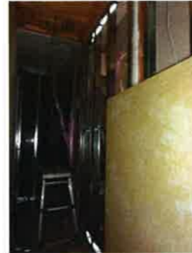
男2人でアッという間に終了