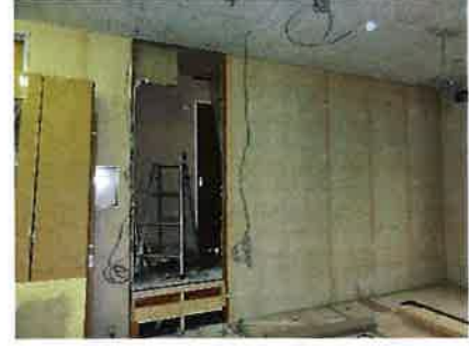
前倉庫側から撮影 床の高さが違うのがわかる