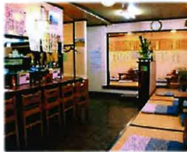
『もつ鍋 たつみ』 長岡市坂の上町3-1-8 営業時間:17時~23時 定休日:日・祝 Tel:0258-39-0630