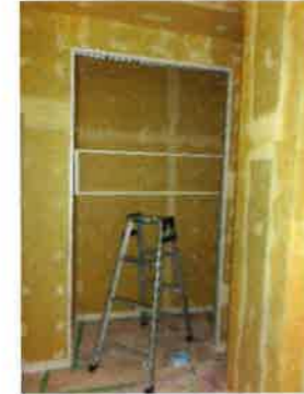
パテで平らにしてからクロスを貼る