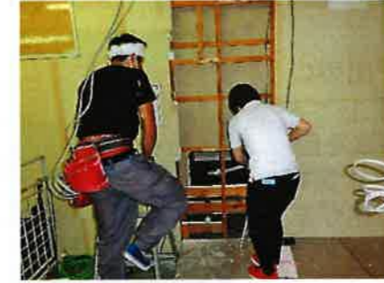
住居側のクローゼットの床が見えた 掃除しながら作業を進める