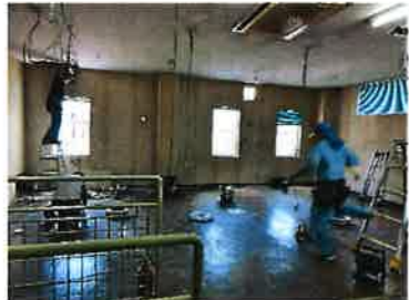
3人がかりで丸一日 部屋の位置を確認しながら 電気の線を出していく