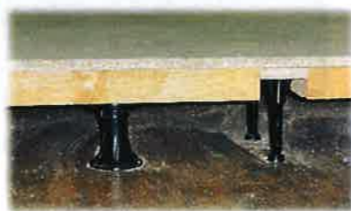
高さ調節可能な足が付いていて 微妙な高さ調整するには 非常に便利な材