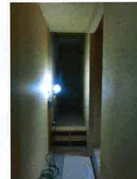
やっと何となく部屋が現れてきた