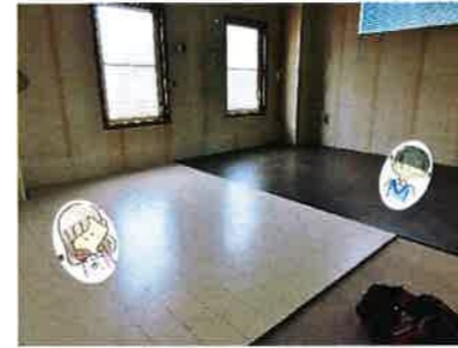
奥がお兄ちゃんの部屋 手前がお姉ちゃんの部屋