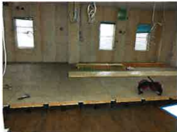
倉庫の床の上に フリーフロアを敷き詰めていく