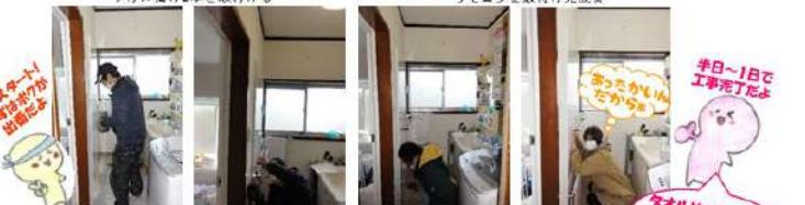
工事スタート！ 洗面脱衣場の 暖房にGO!!