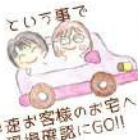
早速がお客様のお宅へ現場確認にGO!!

前号でチョコッと小さくご紹介した洗面脱衣場の暖房器具『HOTウォール』 色々なナット、すぐに反響がありました！☆