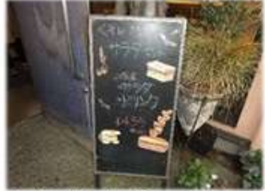
専務の後ろを着いて行くと、「平日限定サラダセット」の看板