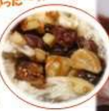
《イチジク入りアフリカパン》