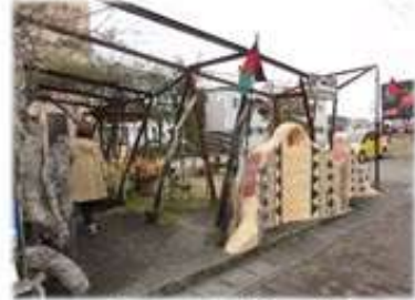
アフリカチックな雰囲気