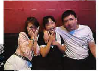
彼女とその彼氏と一緒に長岡に戻り、居酒屋で飲み直しカラオケにも行き、本当に楽しい時間を過ごしました。次はどこに連れて行こうかなあ〜♪