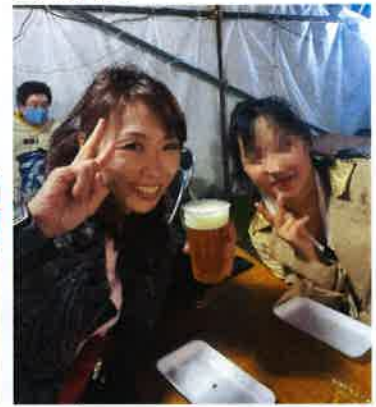
1杯700円の超高級Beer★ いただきま〜す♪