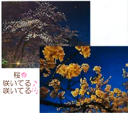
桜咲いてる♪ 桜咲いてる♪