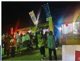
屋台発見★でもお目当てのアレがない