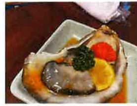
笑うには福来る 編集長 渡辺潤子

3月の某日、帰省してきた娘と一緒に近所の馴染みの居酒屋【在郷】へ行きました。店主は娘を3歳の頃から見ているので、ある意味もう1人の保護者(笑)久々連れて行ったら「おー!!」と目をまん丸にして喜んでくれました。「生牡蠣が食べたかった!!」と牡蠣を注文。東京で食べた牡蠣と比べ物にならない位美味しかった様で、最後にもう1個食べ、帰宅後「実はもう1個食べたかったんだ〜」と。プリプリの大粒牡蠣が驚きの320円。私達にも財布にも優しい【在郷】で友人1人も合流して、3人で楽しく飲んで食べてきました。安くて旨い!お店【在郷】良かったら是非(^^♪