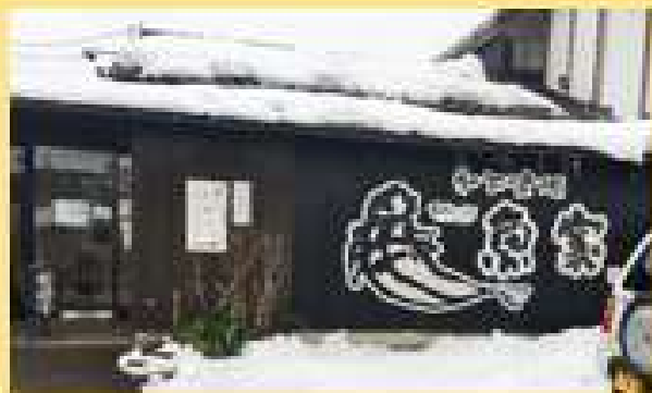
三糸市 『和食喰場 魚家 ~TOTOYA~』

毎号このページが遠辺の趣味趣向記事になってまいりました(笑) なかなか評判のいいんですもん(AA)私の食べ歩き記事(飲み歩き記事とも言う) コロナ禍でデリバリーやお家ごはんが流行ってまいります 『ナベちゃん☆飲食店応援宣言!』 という名のもとにまたまた美味しいモノ行って来ましたのでご紹介します。