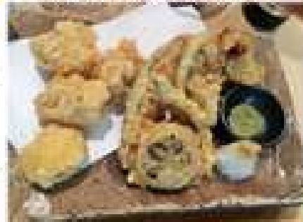
《牡蠣と野菜の天ぷら》

旬の乗ったノドグロ 濃厚な味の牡蠣 食しては日本酒で出し 日本酒の風味を感じつつもまだ食す 至福でした