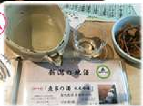
手書きメニューが同様に