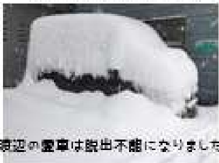
周辺の雪車は脱出不能になりました

いやー、 年末年始の雪には参りましたね。 それでも、お正月はやっばり来客があったりして 【除雪】→【料理】→【掃除】→【除雪】→… の繰り返しで正月休みが終わりました。