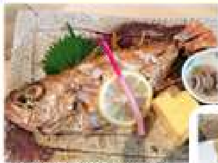
《のどぐろの塩焼き》

旬の乗ったノドグロ 濃厚な味の牡蠣 食しては日本酒で出し 日本酒の風味を感じつつもまだ食す 至福でした