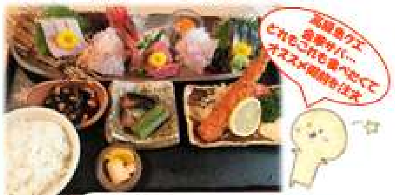
《本日のおススメ御膳》

市場内にも店を構える、まさに市場直結の魚料理専門店。常時20~30種の天然魚を取り揃えており、魚好きが足繁く通う店。新潟清酒の「金の運人」がいる店でも有名