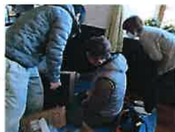
器具を梱包から出し