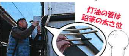
外から見ると穴が…