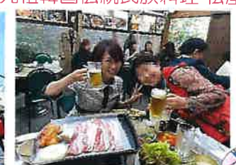
元祖韓国伝統民族料理 松屋