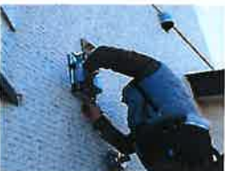
オイルサーバー取付