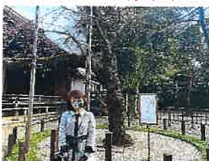
靖国神社の桜標本木

超お腹一杯になったので、帰り道は腹ごなしのつもりで1時間程歩いて帰り初日終了 翌日は友人からチャリ借りて、まるで地元民のフリして東京観光出発です！！