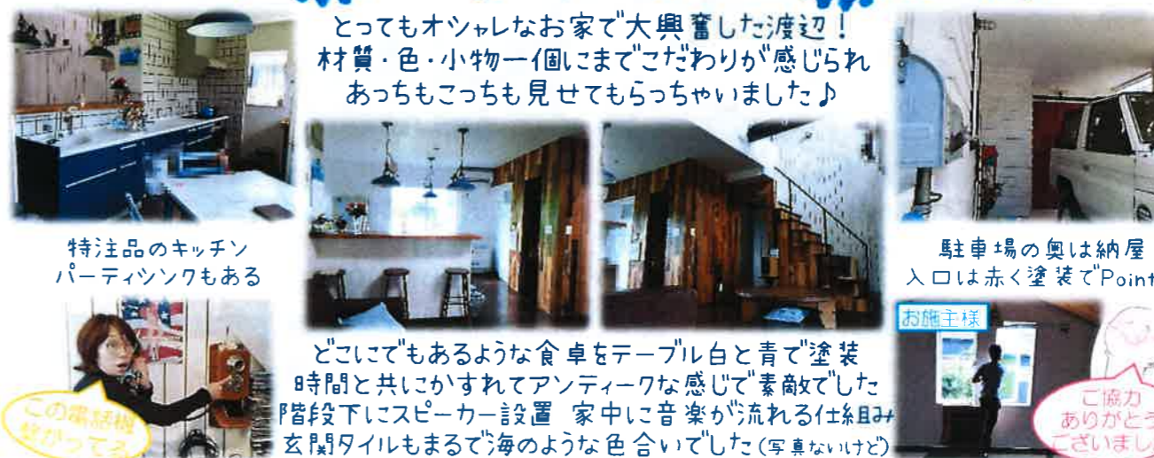
特注品のキッチン パーティンクもある

古屋に10年住み、風の向きや流れ方・日光の当たり具合をよ〜く観察して、 その上で新築する時に窓の大きさや位置を決めたので、夏でも風通りがよく エアコンを使わずに過ごす日も多いとか。かなり考えに考えられたお家でした。 奥様は内窓を入れたら外の騒音から解放され、とても喜んでいらっしゃいました。 冬の暖房効率だけでなく、紫外線もカットでき夏の冷房の効きも良くなる Low-Eガラスの内窓はおススメです。