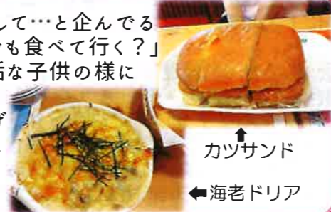
カツサンド ←海老ドリア

lunch 現場の帰り、お〜とそろそろお昼だぞ。もしかして…と企んでる 渡辺に全く気が付かず、ニッコリ笑顔で「ご飯でも食べて行く？」 と専務。内心したり顔で「うんうん、行く」とまるで純真無垢な子供の様に 喜んでついて行く私。この日もそんな感じでコメダ珈琲店で ご馳走になっちゃった。超特大最サイズとテレビでも採り上げ られたカツサンドを食べた専務は「もう夕飯もいらない…」と